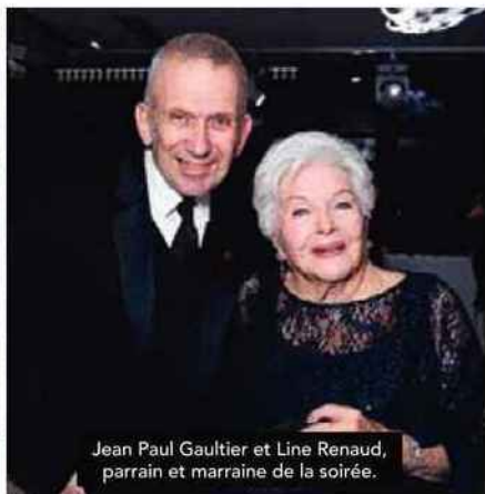
Jean Paul Gaultier et Line Renaud, parrain et marraine de la soirée.