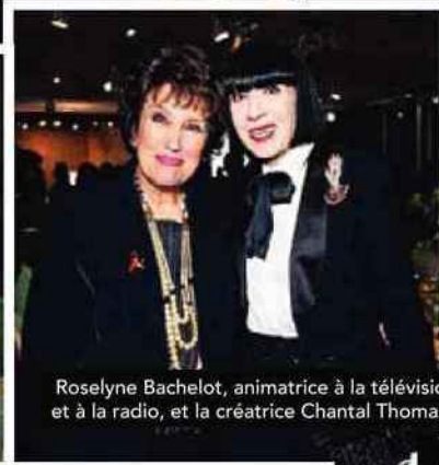
Roselyne Bachelot, animatrice à la télévision et à la radio, et la créatrice Chantal Thomass.