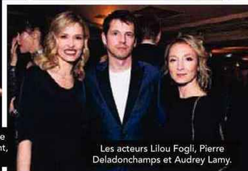
Les acteurs Lilou Fogli, Pierre Deladonchamps et Audrey Lamy.