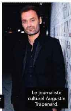
Le journaliste culturel Augustin Trapenard.