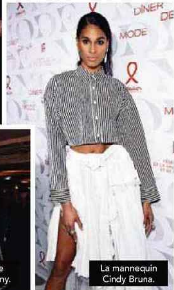
La mannequin Cindy Bruna.