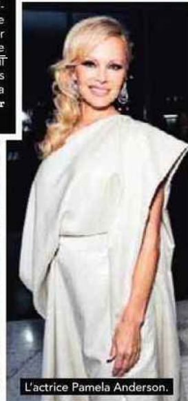
L'actrice Pamela Anderson.