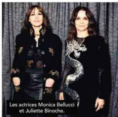
Les actrices Monica Bellucci et Juliette Binoche.