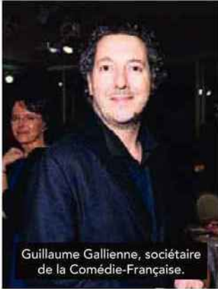
Guillaume Gallienne, sociétaire de la Comédie-Française.