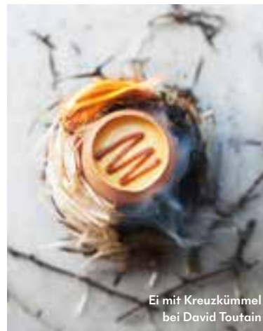
Ei mit Kreuzkümmel bei David Toutain

Außergewöhnliche Gerichte mit subtiler Note werden in elegant-opulentem Ambiente in einem Stadthaus aus dem 19. Jahrhundert serviert. In der Küche steht der legendäre Sternekoch Christopher Pelé.